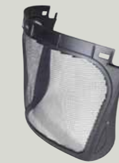
5B Netzvisier Polyamid

Hinweis: Achten Sie auf die Kennzeichnungsetiketten um sicherzustellen, dass das gewünschte Klarvisier/Netzvisier mit der Kopfhalterung kompatibel ist.