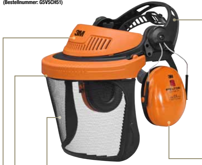
3M™ Gesichtsschutz- und Gehörschutzkombination G500 für den Forst (Bestellnummer: G5V5CH51)