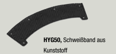
HYG50, Schweißband aus Kunststoff