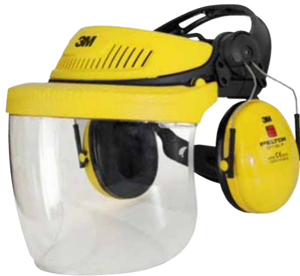
3M™ Gesichtsschutz- und Gehörschutzkombination G500 für die Industrie Diese Kombination besteht aus der 3M™ Kopfhalterung G500, einem PC-Visier (V5F) und einem Optime I Kapselgehörschützer (H510P3E).

Neben Stil und Design zeichnet sich die Kopfhalterung vor allem durch ihre stabile Bauart und lange Haltbarkeit aus. Durch die Reduzierung von flexiblen Materialien wurden Verformungen des Produkts im rauen Alltagsbetrieb verringert und somit die Lebensdauer des Produkts verlängert. Gleichzeitig wird eine optimale Schalldämmung beim Tragen in Kombination mit Kapselgehörschützern gewährleistet.