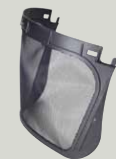
5C Netzvisier Edelstahl