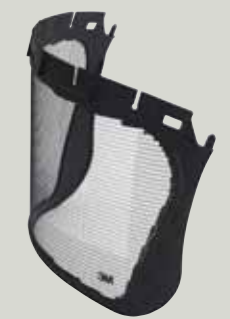
5J Netzvisier Ätzmetall