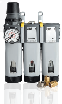
Wandmontierte Aircare Einheit ACU-01